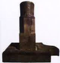
Linga - Yoni

博物館への道 - ダナン空港から：4キロの距離 - ダナン港から：7キロの距離 - ダナン駅から：6キロの距離 - ダナンバス駅から：10キロの距離