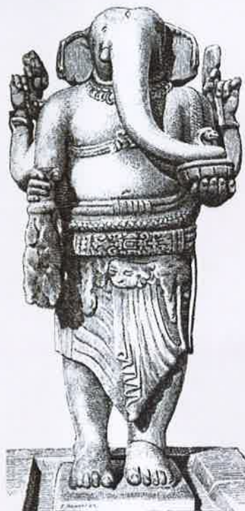
ガネーシャ アンリ・パルマンティエの図