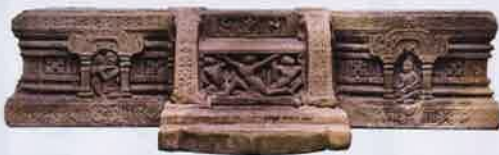
Altar - 国宝

ダナン市から南へ70キロ離れたミー・ソンは、4世紀から13世紀まで約10世紀の間にチャムバ王国の重要な信仰拠点でした。ミー・ソン室では、独特なテーマや様式を持っている様々な展示物を紹介し、長期間にわたったチャム彫刻芸術の発展を反映しています。