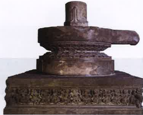
Altar - 国宝

チャンパ王国の最古首都の一つであるチャキユウはダナン市から西南へ約50キロの距離に位置しております。チャキユウ様式は、王国設立の早期にわたるヒンドゥー教からの影響を表現しています。その生き生きとした、調和のとれた魅力は深い印象をもたらします。