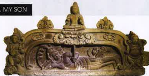
The birth of Bhrama