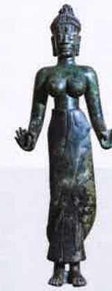
Bodhisattva Tara 国宝