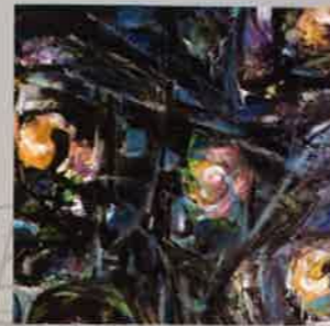
NGUYỄN VINH PHÔI Nguồn sống | Life source Sơn dầu Oil on canvas 120x150 (cm) 2014