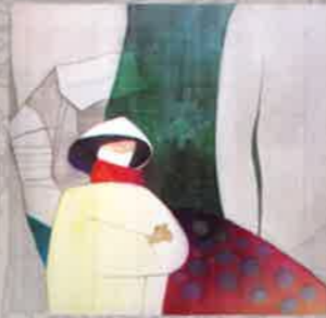
LÊ VĂN Người về cuối rừng Returning to the end of the forest Lụa Silk 90 x 115 (cm) 2010