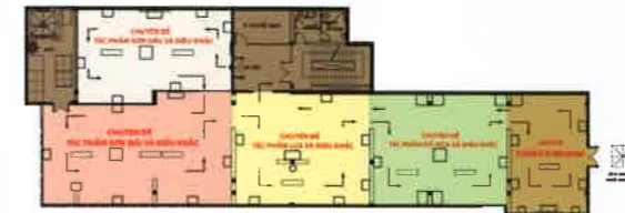
SƠ ĐỒ TẦNG 2 PLAN OF 2 nd FLOOR