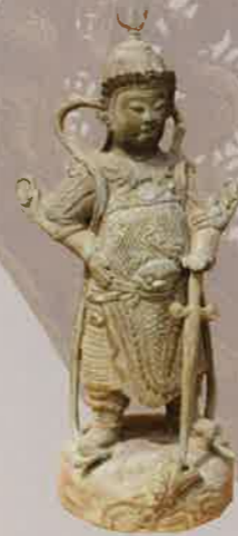
Tượng Hộ Pháp The Guardian Chất liệu: Đồng | Bronze