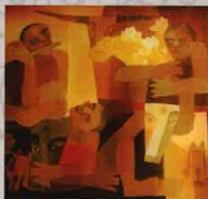
NGUYỄN TRỌNG DŨNG Mùa vàng | Golden crop Lụa Silk 86 x 144 (cm) 1999