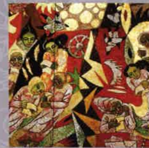
TRỊNH HOÀNG TÂN Thư ở đảo Letters from islands Sơn mài Lacquer 120 x 180 (cm) 2014