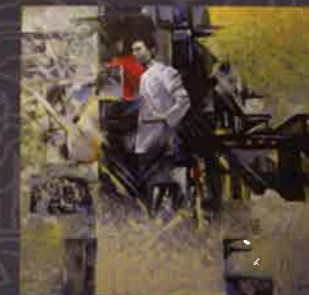
TRỊNH BÁ QUÁT Sống như anh | Live as he did Sơn dầu Oil on canvas 150 x 150 (cm) 2014