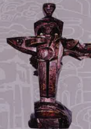
TRẦN VĂN ĐỨC Mắt biển | The eye of the sea Gỗ | wood 73 x 35 x 97 (cm) 2013