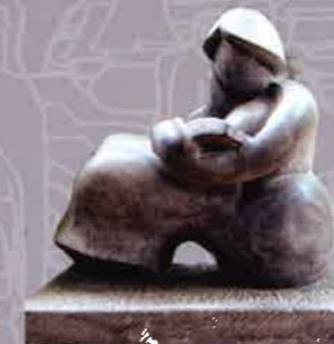
PHẠM HỒNG Văn hóa đọc | Reading culture Đá Stone 25 x 45 x 55 (cm) 2009