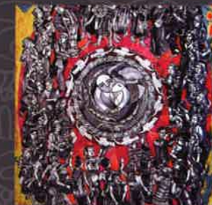
NGUYỄN TƯỜNG VINH Người Việt Nam | Vietnamese Khắc gỗ Woodcut 80 x 150 (cm) 2013