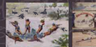
NGUYỄN ĐỨC HẠNH Chùm ký họa kháng chiến Sketches about the resistance war Bột màu Gouache