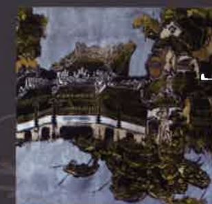
TRẦN NGUYỄN ĐÁN Hội An | Hoi An Khắc gỗ Woodcut 40 x 60 (cm) 2010