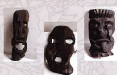
Bộ các tác phẩm điêu khắc Cơ Tu A set of Co Tu sculptural works Chất liệu: Gỗ | Wood