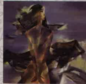
HỒ HỮU THỦ Thiếu nữ và biển | Girl and the sea Sơn dầu Oil on canvas 100 x 100 (cm) 2015