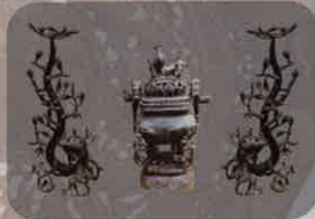
Bộ lư tre hóa rồng Set of incense - burners "Bamboo turning into dragon" Chất liệu: Đồng | Bronze