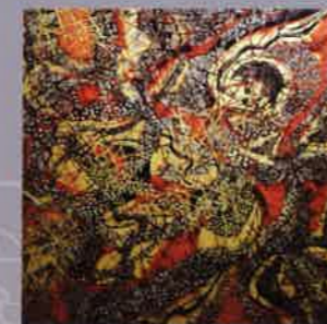
TRƯƠNG BÊ Thế giới hạt The world of grains Sơn mài Lacquer 86 x 144 (cm) 1999