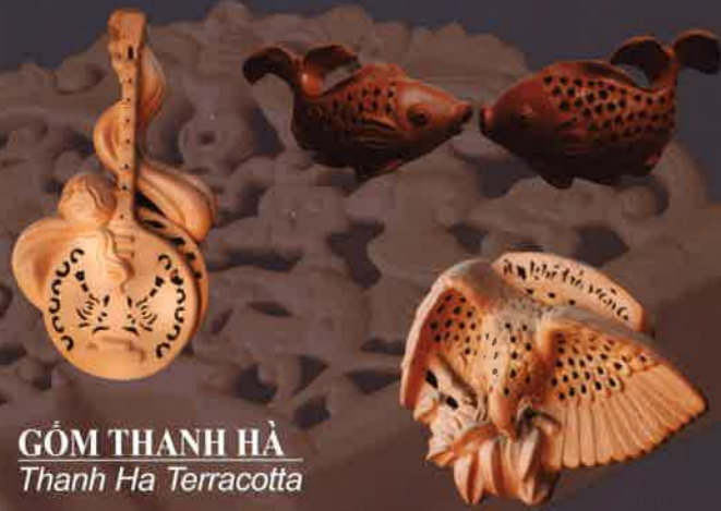
GỐM THANH HÀ Thanh Ha Terracotta