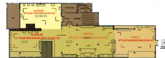
SƠ ĐỒ TẦNG 3 PLAN OF 3 rd FLOOR