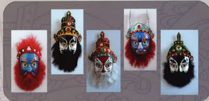
Mặt nạ Tuồng Masks used in Tuong performance