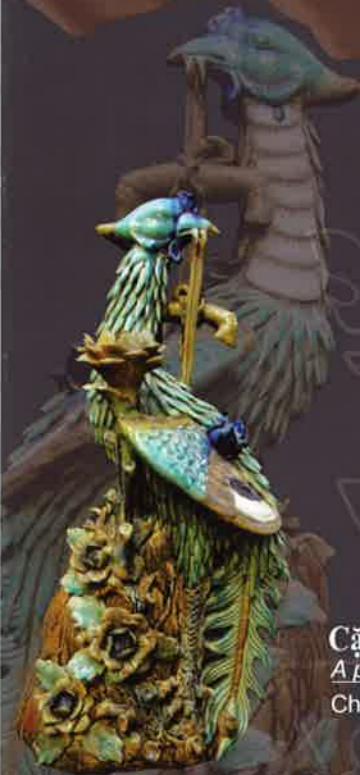
Cặp Chim Hạc A pair of cranes Chất liệu: Gốm | Ceramic